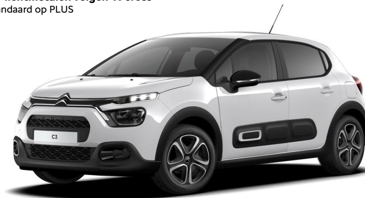
16" lichtmetalen velgen 'X-cross' Standaard op PLUS