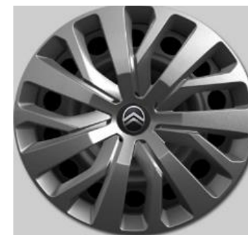
16" volwaardige wioldoppen TONGARIRO (i.c.m. Pakket Comfort Connect Style)