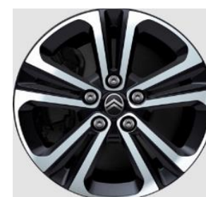
16" Lichtmetalen velgen TARANAKI