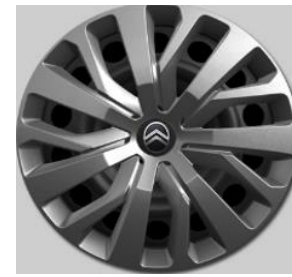
16" volwaardige wioldoppen TONGARIRO