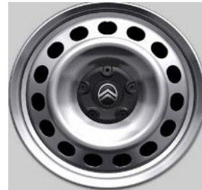
Standaard 15" Wioldoppen