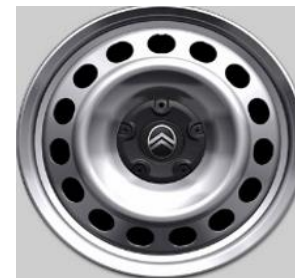
Standaard 16" Wioldoppen