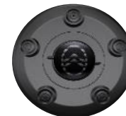
WIELNAAAFDEKKING ZHYV, ZHYW, ZHZQ Standaard