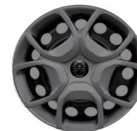
17-INCH WIELKAP ZHYY Standaard bij Exterieur pakket