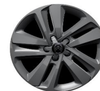
17-INCH LICHTMETAAL ZHZJ € 650,00 (787)