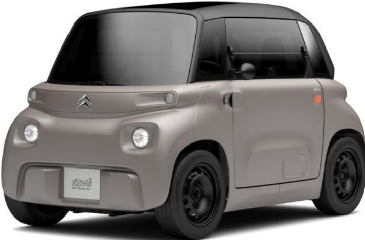
My Ami Ami € 0