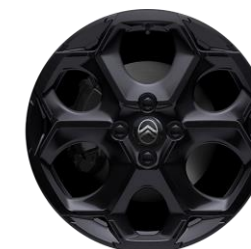
17" ATACAMITE BLACK